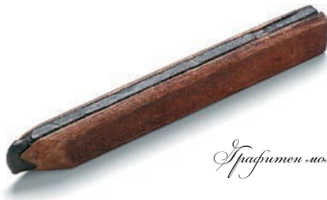
Графитен молив от 17th век

Както станало ясно по-късно, графитът от Кумбриановите мини бил експлоатиран неразумно, използван в чистата си форма за създаване на опростени моливи. Когато резервите започнали да привършват, износът му бил забранен „на живот и смърт”, според един източник. Оскъдицата на това „черно злато” довели до скачане на цените му докато накрая то струвало 200 франка за един паунд на международния пазар. В същото време, качеството и на графита, и на създаваните от него моливи се влошило. Единствено благодарение на монопола върху тях Англия успяла да запази толкова високи цени за толкова нискокачествени продукти. Свързващи елементи като лепило, латекс или смола били използвани да „разтеглят” графита.