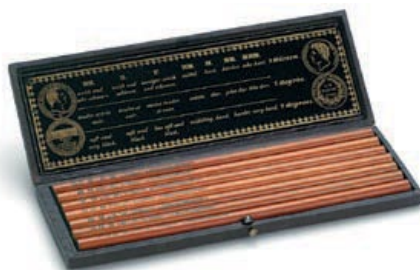
Първите нарковни моливи, A. W. Faber Pencilworks