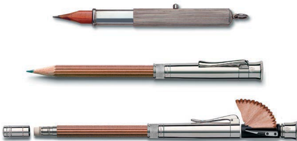
Джобен молив от 1885 и "перфектният молив" от колекцията на Граф фон Фабер - Кастел от 1993 г.

С колекцията на граф фон Фабер - Кастел, компанията отново става успешна във въвеждането на необикновени нюанси в културата на ръкописа. Един уникален свят от черен графит и мастило се развива за да създаде „перфектния молив”. Функцията се основава на продукти от миналото, докато естетическият дизайн притежава елегантност, която не остарява. Използват се само естествени материали, например подобрена дървесина, комбинирана с атрактивни метални елементи.