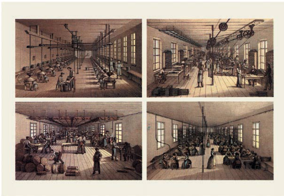
Компания А. В. Фабер, около 1860